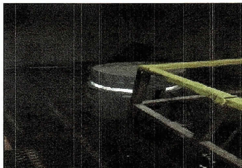
Fotografía 1: Equipo Automático Instalado