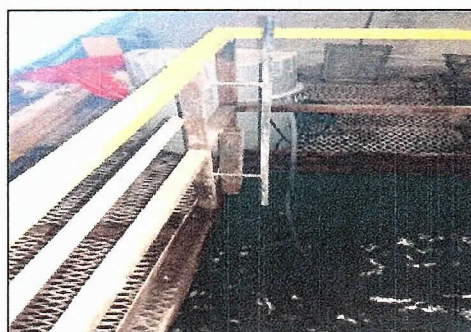
Fotografía 3: Punto de Monitoreo