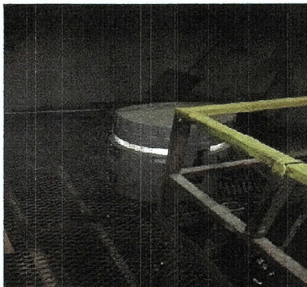
Fotografia 1: Punto de Muestreo